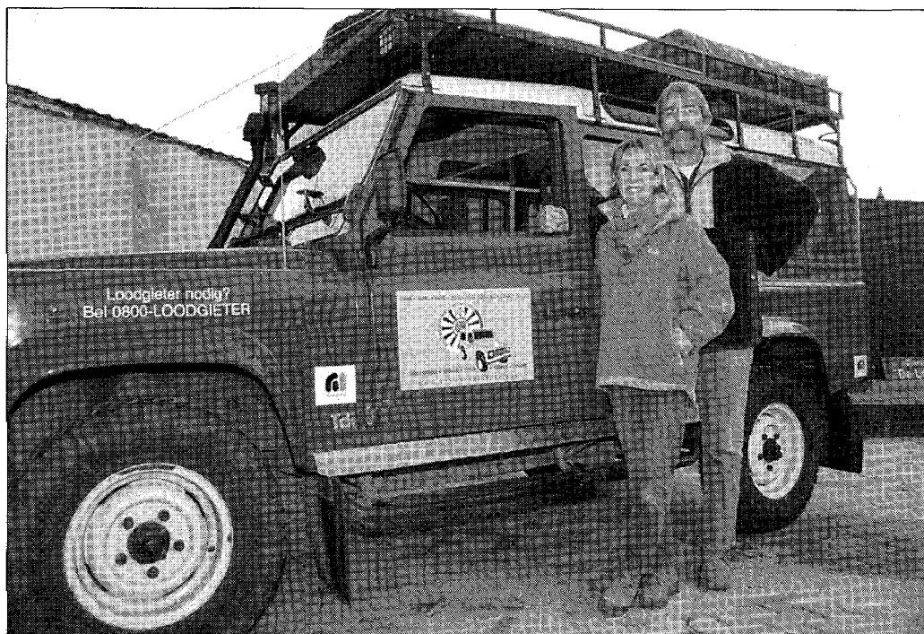
Na maanden van voorbereiding komt de reis eindelijk in zicht.