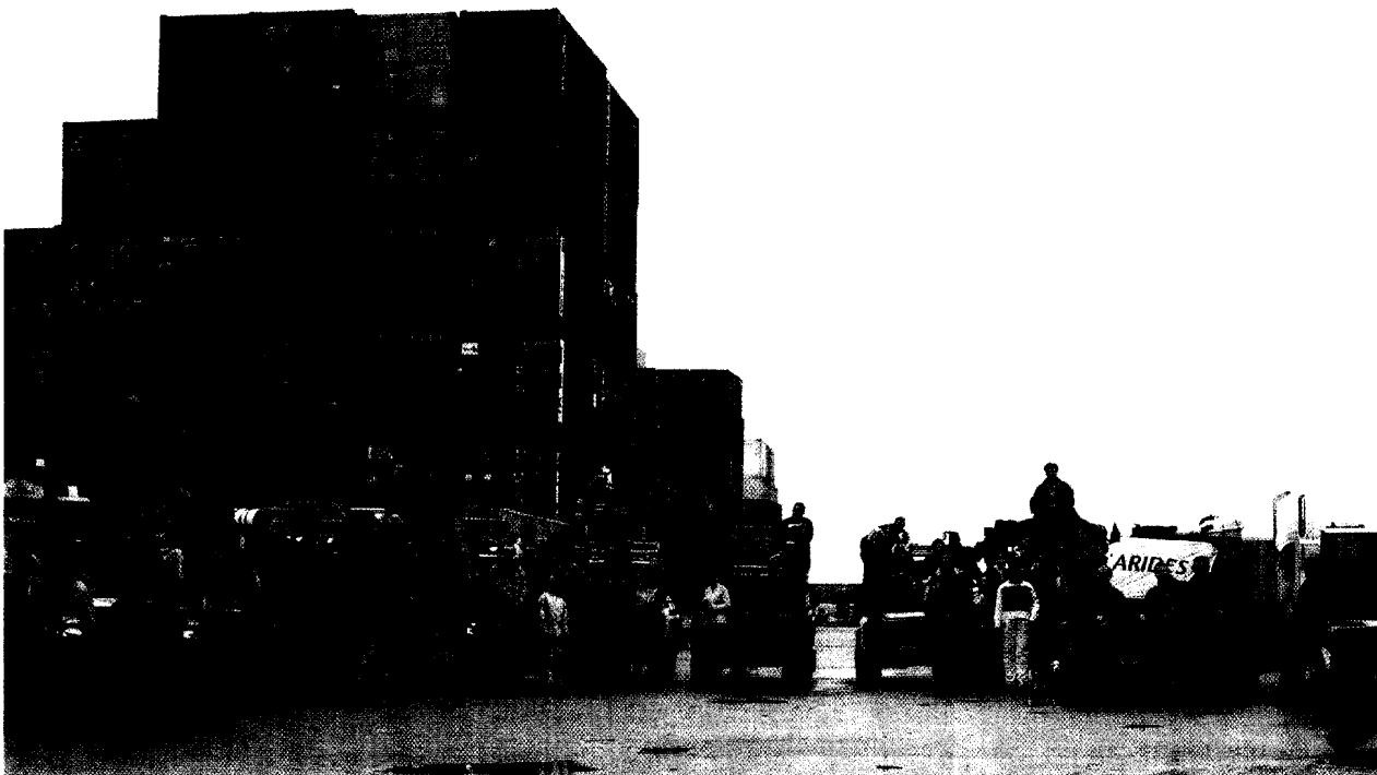
Scholen naar China

(Meer informatie op de website roundtabletour.nl ),