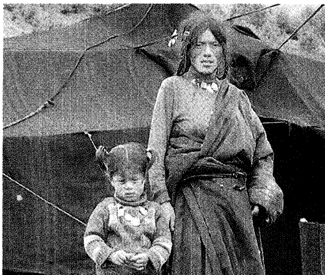
'Onderweg komen we nomaden tegen, die in tenten op de hoogvlaktes leven.'