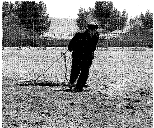
Op het platteland van China: een boer trekt een eg door het zand.